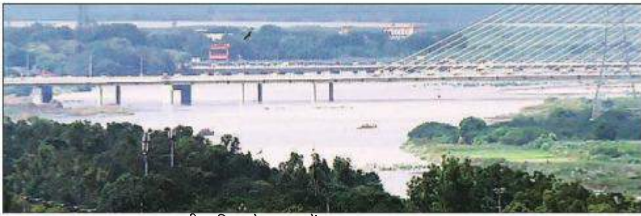
भारी बारिश से यमुना में लगातार बढ़ता जलस्तर।